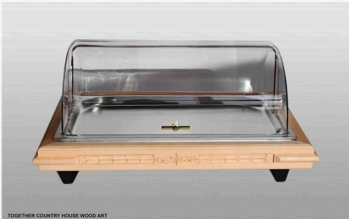
TOGETHER COUNTRY HOUSE WOOD ART

TOGETHER COUNTRY HOUSE WOOD ART ist ein komplettes mobiles/ tragbares Kühlmöbel für das Buffet.